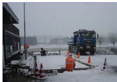
Gereed voor bestrating