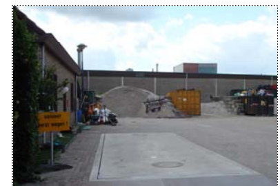
Gereed voor kalibratie en gebruik