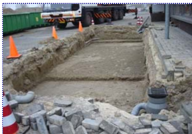
Grondwerk voor fundatie