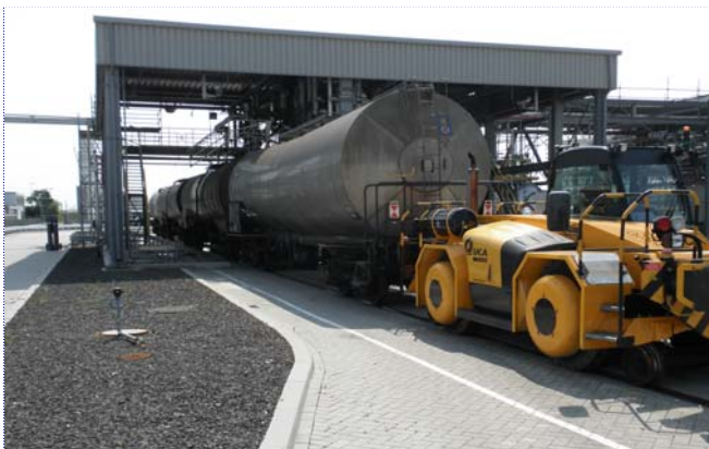
Wagonweegbrug voor het vullen van wagons