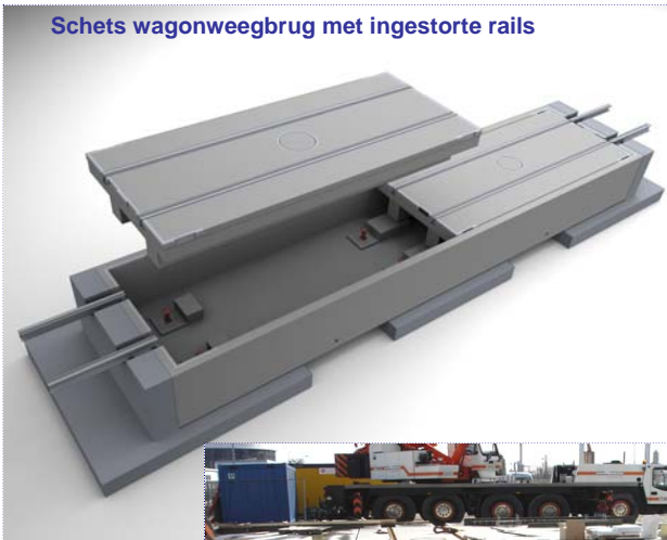
Schets wagonweegbrug met ingestorte rails