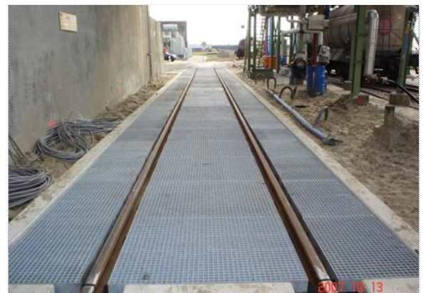
Speciale voertuig/wagonweegbrug met doorstortdek