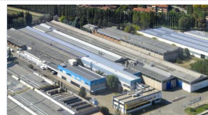
▲ Hoofdkantoor/fabriek Bilanciai Italië