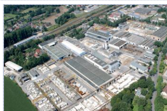
▲ Productie in Duitsland van prefab betonnen weegbrug modules